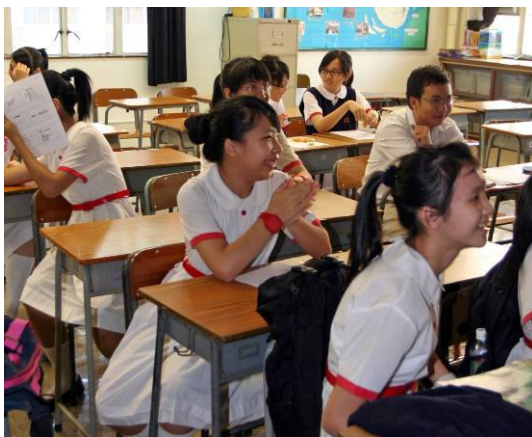
同學集中精神，聆聽講解。