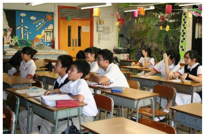
在迎新活動中，同學積極投入，寓學習於娛樂。