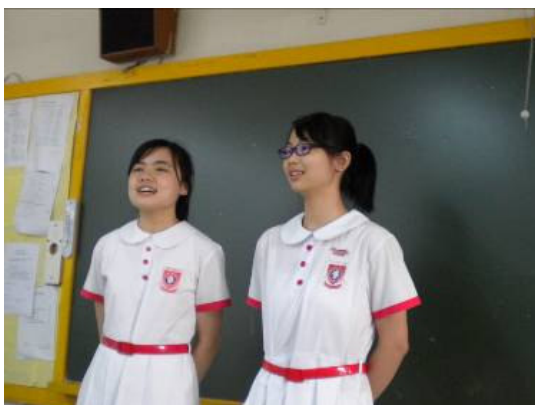
透過演說比賽，提高同學對普通話的興趣，並發揮合作的精神。