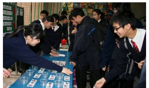
元宵攤位遊戲「歷史人物對對碰」，既考同學的常識，亦考同學的眼界，同學樂在其中。