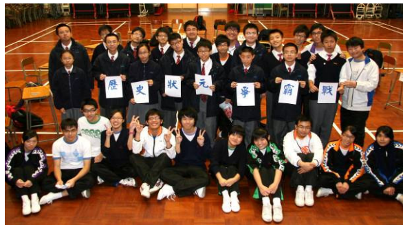
我們是真正的歷史狀元！同學要經過砌圖、必答題、搶答環節才可登上歷史狀元寶座！