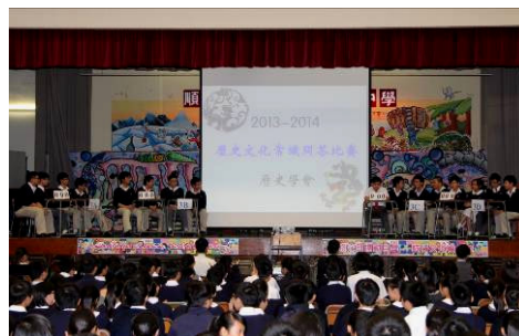
歷史常識問答比賽