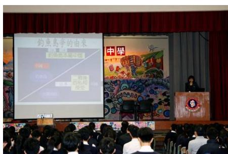
有關釣魚台列島的週會講座