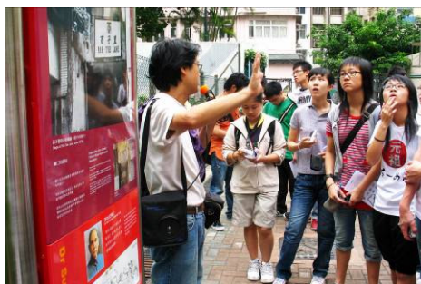
同學參與歷史文化遊