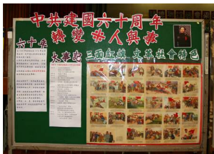
中共建國六十年、人與事、跌宕與變遷，濃縮在展覽的文字圖片中，加深同學對中國近代史的認識。