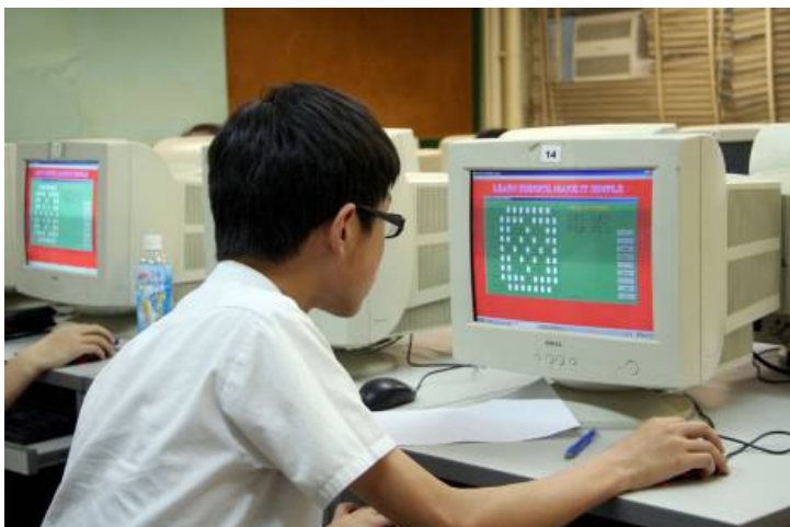
數獨可掃毒（掃思想閉塞之毒）